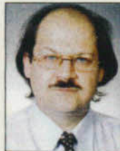
Γράφει ο Γεώργιος Κ. Χατζάρας Χειρουργός Οφθαλμίατρος Συνεργάτης του Κυανού Σταυρού

Η επέμβαση γίνεται όταν δημιουργούνται προβλήματα στις καθημερινές δραστηριότητες του ασθενούς. Δεν είναι πλέον